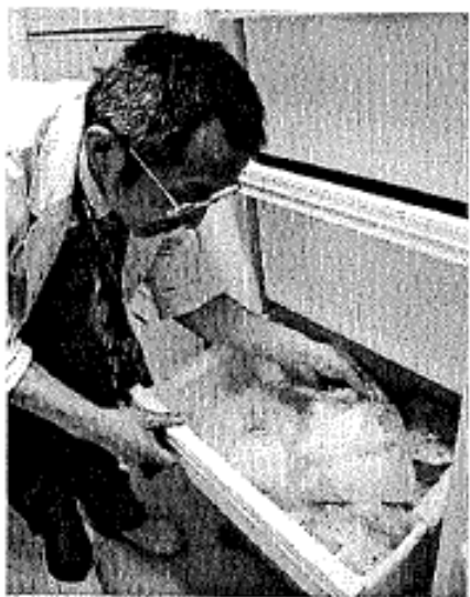
早産児に提供するため、冷凍保存された母乳(東京都江東区の昭和大学江東豊洲病院で)

母親の母乳の出の悪さや病気などで母乳をもらえない早産児らに、病気の予防のため、別の女性の母乳を与えるもらい乳を、全国の新生児集中治療室(NICU)の25%が実施していることが、厚生労働省研究班による初の実態調査で分かった。殺菌していないもらい乳を通じ、早産児が感染症にかかったとみられる例もあり、研究班は今年度中に殺菌の手順などをまとめた運用基準を策定する。